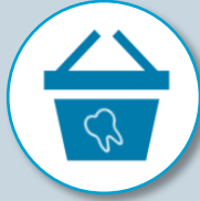
Panier maîtrisé (uniquement en dentaire)