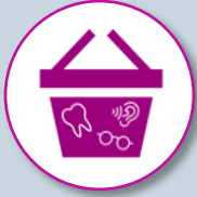
Panier 100% Santé

Désormais chez votre professionnel de santé (opticien, dentiste, audioprothésiste), vous aurez le choix entre différents types d'équipements regroupés en 3 paniers :